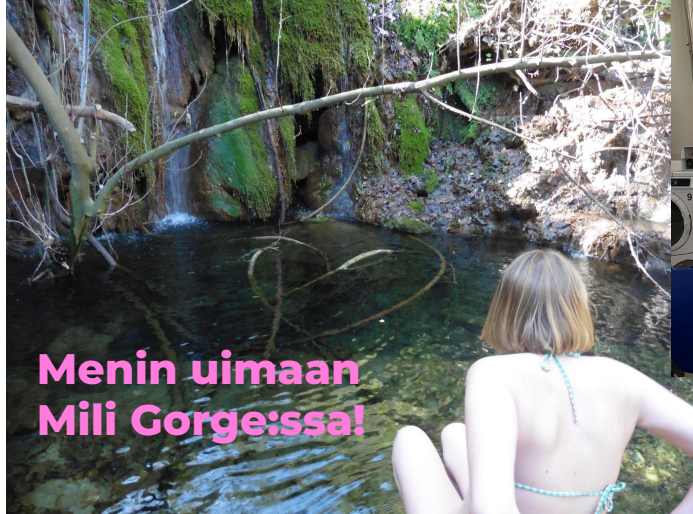
Menin uimaan Mili Gorge:ssa!